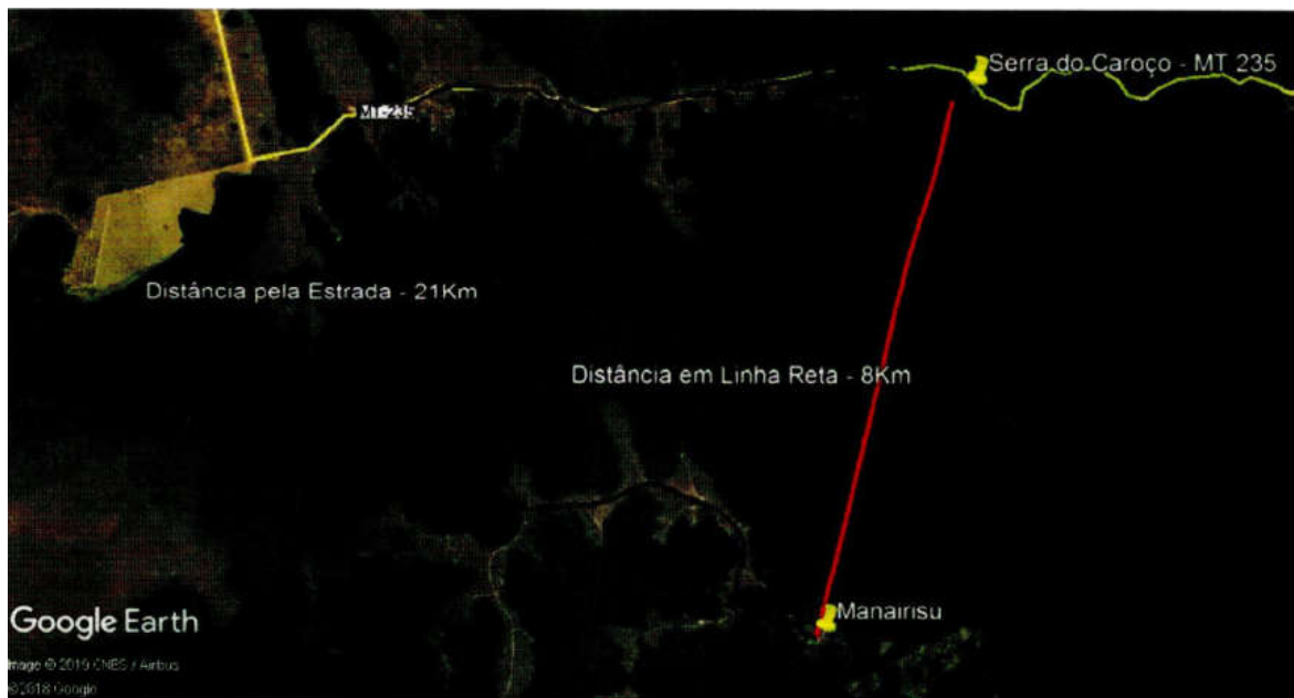
Ofício n.º 769/GP/2019, fl. 21